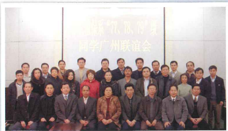
植保新三届广州同学聚首母校