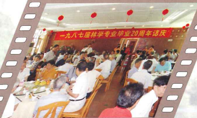
87届林学专业同学回母校与师长们共庆毕业20周年