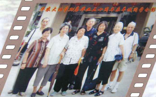
56届林学同学毕业50周年留影