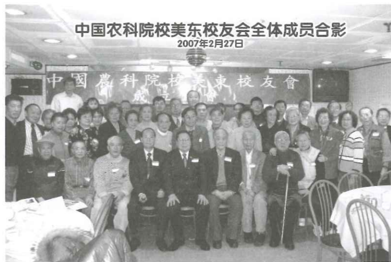
中国农科院校美东校友会全体成员合影 2007年2月27日