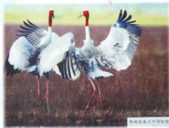
越南前副总理阮功丹校友代表58届越南留学生赠送给母校的纪念品