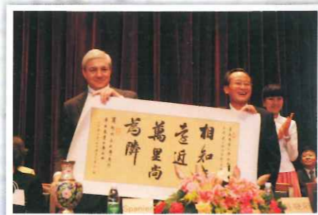
学校与美国宾州州立大学共庆百年合作友谊