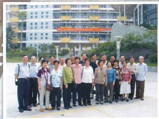
69届遗传育种班同学新教学楼前合影